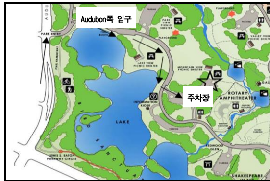
= 야외소풍 장소 (별표: 마운틴뷰 쉼터) =

This change is never easy. It rubs against our grain. It’s inconvenient and requires more of our patience and consideration for others. We should be mindful of our behavior if it is objectionable to other people/culture. This is walking God’s way than my way. In sum, it’s only possible when we become mature Christian. (Rev. Young Kwon)